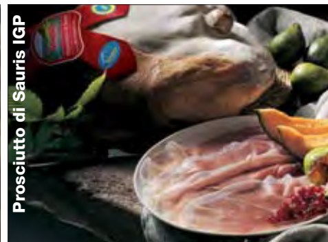
Prosciutto di Sauris IGP