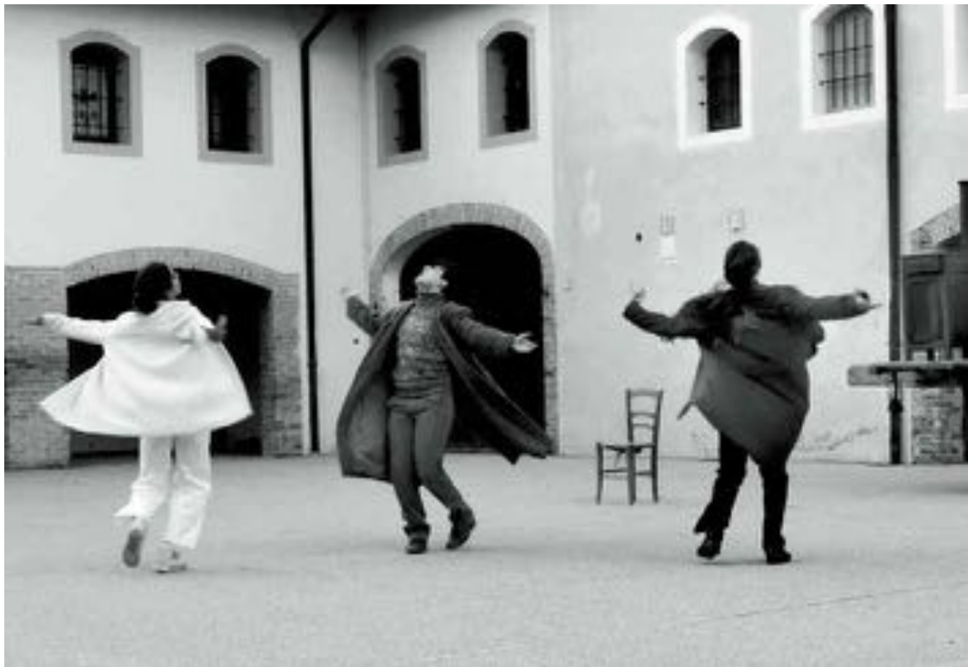
La morteana_San Zuan di Cjasarse, ai 7 di Novembar 2021