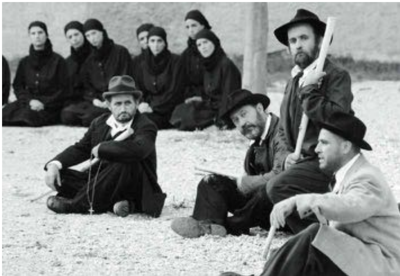
I turcs tal Friúl Ai Colonos