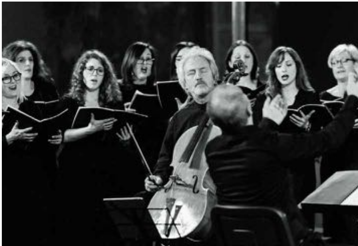
Coro dal Friül-Vignesie Julie