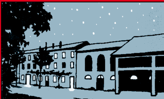
Disen di Elisabetta Ursella