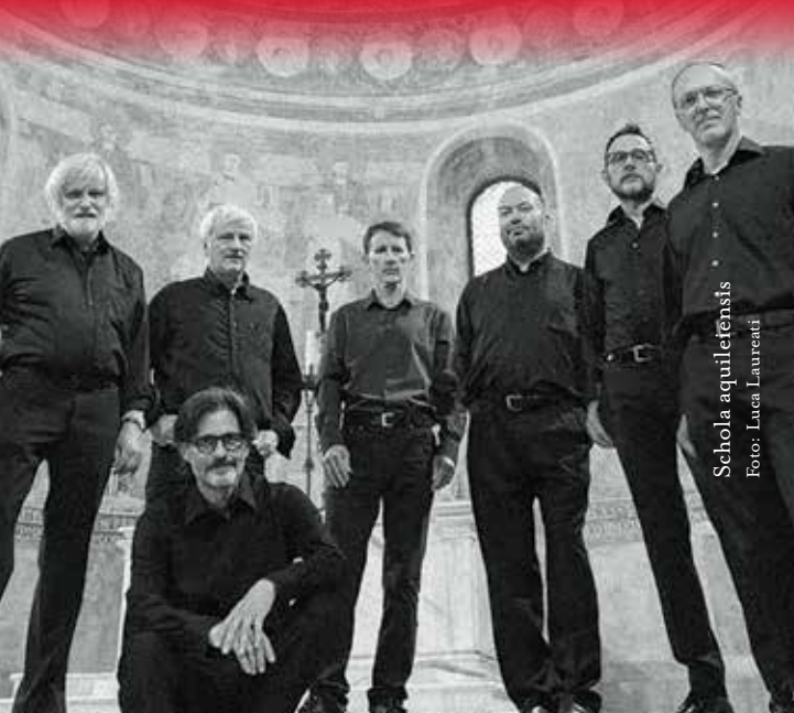
Schola aquileiensis

A Cividât dal Friûl, tal Museo Archelogjic Nazionâl, al è conservât un patrimoni musicâl storic straordenari tal so gjenar. Si trate di un grup di dodis polifoniis primitivis registradis in dis codiçs difarents, che daûr dai studiôs a dan dongje un corpus di presi par cuantitât e tipologjie dai tocs, cualchidun ancje unic. Dopo di un prin moment in nomine, mediant di une cuvigne internazionâl inmaneade a Cividât tal 1980 su la sburte di Gilberto Pressacco, a son vignudis fûr tal panorame musicâl dome incisions isoladis di sengui discjants, intune uferite no organiche e dispès pôc filologjiche. La Schola aquileiensis, ative di plui di cuarante agns ta la riscuiverte e ta la difusion dal patrimoni musicâl dal Patriarcjât di Aquilee, dopo di un impuartant impegn di analisi, trascrizion e contestualizazion liturgjiche dai tocs, e à proponût par la prime volte, cu la publicazion di un CD cun librut di compagnament, l'esecuzion integrâl dai tocs dentri tal lôr contest liturgjic.